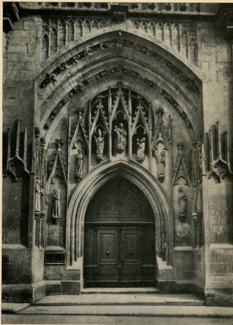
Porche latéral de la cathédrale St-Nicolas à Fribourg